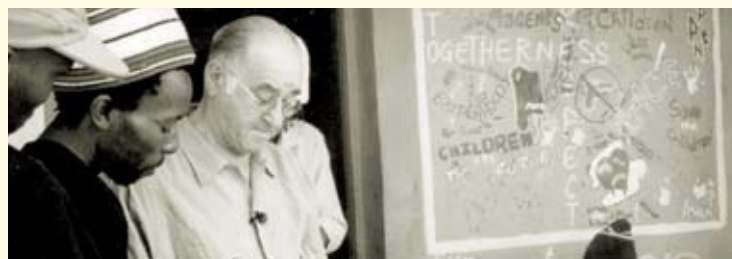
Alfred Biolek beim Besuch eines Jugendaufklärungsprojekts in Südafrika.

Nur umfassende Aufklärung und der Zugang zu Verhütungsmitteln können diesen Zustand ändern!